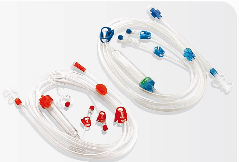
B series & B original Haemodialysis Set