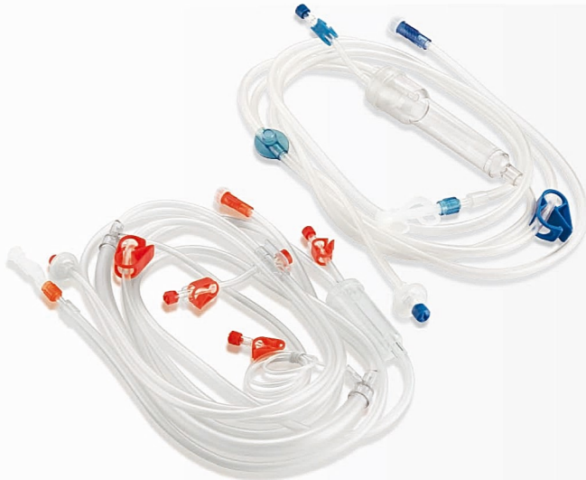
S-classix, Haemodialysis Set

ست‌های مورد استفاده در عمل همودیالیز شامل ست وریدی و شریانی می‌باشد که در هنگام عمل همودیالیز و تصفیه خون بیماران نیازمند درمان همودیالیز به کار می‌رود. این ست‌ها در هنگام عمل همودیالیز به سوزن فیستولای مناسب (ست وریدی به سوزن فیستولای وریدی و ست شریانی به سوزن فیستولای شریانی) و صافی دیالیز متصل می‌گردند. ست شریانی خون را از بدن بیمار به ورودی خون صافی دیالیز و ست وریدی خون را از خروجی خون صافی دیالیز به بیمار منتقل می‌نماید.